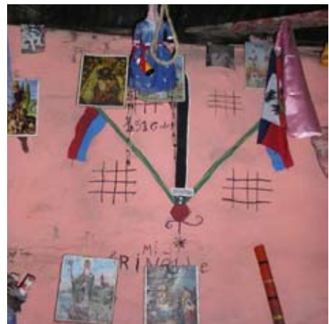
Figure 1: Vodou temple. The spirit Ogou's ceremonial drawing here includes Haitian flags.