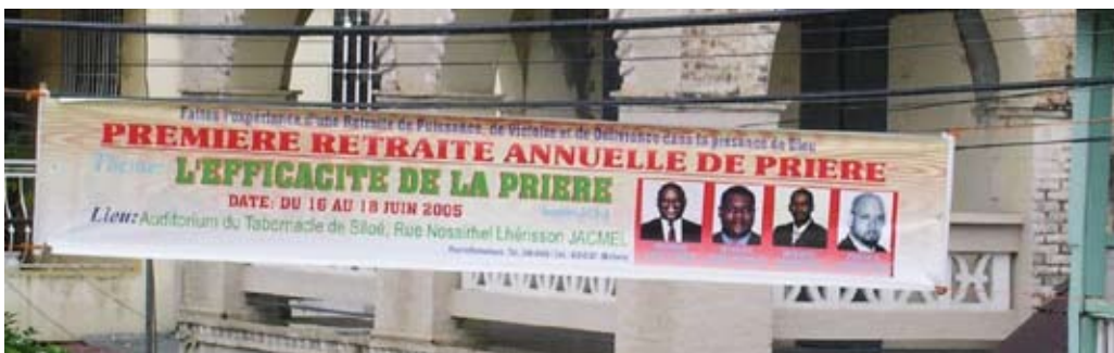
Figure 2: Protestant publicity beginning "Make the experience of a Retreat of Power, Victory and Delivery in the Presence of God." Even if Protestants may criticize Vodou, few seem prepared to support activities such as crusades to Vodou sites.

In the world of scholars there is an ongoing debate regarding the role Vodou played in the Haitian Revolution. The Bwa Kayiman ceremony, whether it ever took place and, if so, in what form, is a case in point. Some scholars, such as Price-Mars (1973),