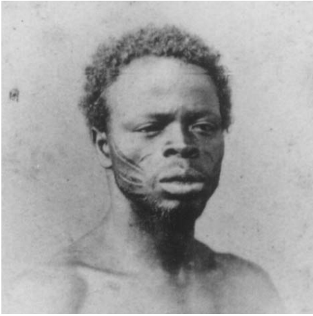
Figure 1: African with facial scarification. Christiano Jr., Rio de Janeiro, ca. 1865. Arquivo Noronha Santos, Instituto do Patrimônio Histórico e Artístico Nacional, Rio de Janeiro.