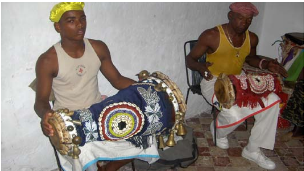
Figure 2: Drummers with the sacred batá drums during a Santería ritual.

On the preparatory day the initiate, known as iyabó , rips his/her clothes to pieces and bathes in