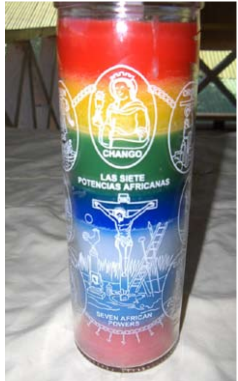
Figure 3: A candle made of glass with the seven most powerful Santería divinities. It is used in healing rituals by Miskitu healers, both when the candle is burning and when empty.

The Miskitu are occasionally troubled by a so-called “culture bound” syndrome (Dennis, 1985) known as grisi siknis (“crazy sickness”), a highly contagious affliction and a serious social problem in which people are said to be possessed by spirits. In 2003 and 2004, for example, a large-scale epidemic affected a number of Miskitu villages. The majority of the victims were adolescent women. However, people of all ages can catch the malady and during the last years there have been places where more men than women have been afflicted. Dennis (1985,