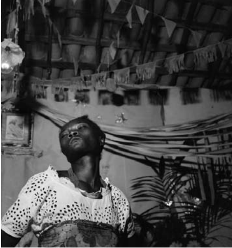
Figure 6: Initiate in trance, Opô Afonjá. Pierre Verger, 1950s. Used by permission of the Pierre Verger Foundation, Salvador, Bahia, Brazil.