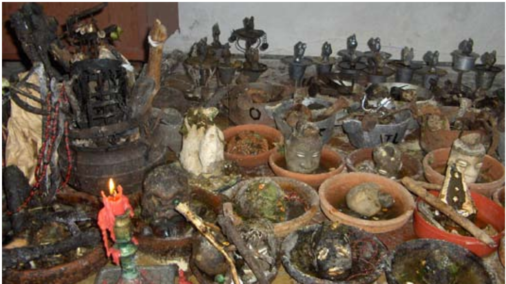
Figure 1: Santería objects prepared for animal sacrifice. The small "heads" with eyes and mouth of seashells represent Elegguá, the trickster divinity. He opens the "roads" in life and always receives sacrifices first.

All of these divinities are found in hundreds of mythological stories and proverbs, which, in turn, are related to various divination systems. It is said that the santos "speak" through divination. The santos are also carriers of ashé , life force. As hu-