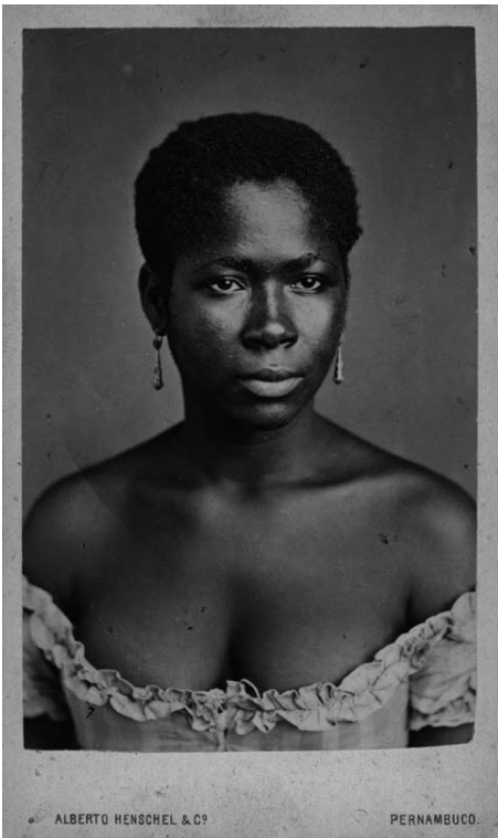
Figure 2: Black woman in Pernambuco. Alberto Henschel, ca. 1869. Used by permission of Leibniz-Institut für Länderkunde, Leipzig, Germany.