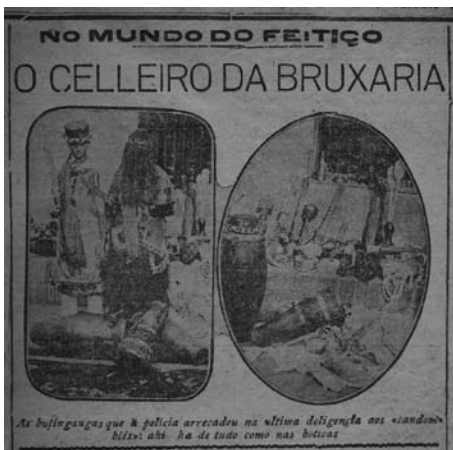
Figure 4: Objects seized during an early 20th century police raid on a Candomblé ceremony. The headline reads, "In the fetish world: the cellar of witchcraft." A Tarde , Salvador, Bahia, Brazil, May 22, 1920.