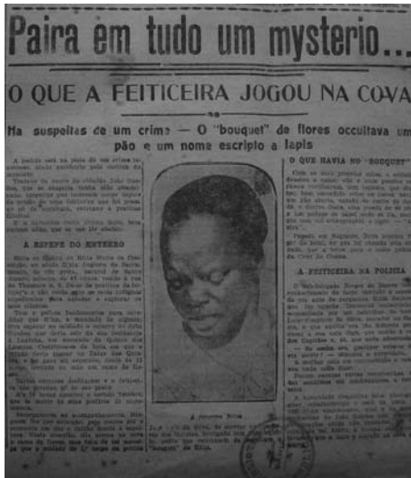
Figure 3: Front page article describing a woman's arrest. The headline reads, "What the witch threw into the grave." A Tarde , Salvador, Bahia, Brazil, October 16, 1923.

Photography, for its part, celebrated as a veritable symbol of Western artistic modernity (see Benjamin, 1968), has come under criticism for its