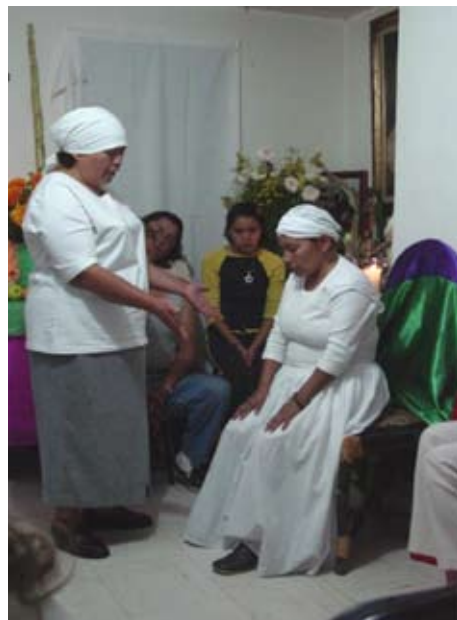
Figura 1: Médium trinitaria mariana, sanadora y santera en proceso de recibir a su “protectora”: la Hermana Blanca (la Santa Muerte) en día de muertos (2 de noviembre).

Asimismo habría que señalar, que bajo el término genérico de santería existe una complementariedad en su práctica que abarca tanto al espiritismo kárdéciano, al palo mayombe así como al catolicismo popular (culto a santos y vírgenes). K. Argyriadis (1999) señala que para el caso de Cuba este conjunto de modalidades complementarias es designado bajo el término genérico de la Religión . Dentro del contexto mexicano, esta complementariedad de origen se entrecruza y se refuerza con dos marcos culturales que fungen como factores propulsores de su divulgación en México y también de su apropiación muchas veces complementaria. Por un lado, el de las tradiciones de arraigo prehispánicas y coloniales (yerberos, curanderos, “brujos”...) ligadas a las prácticas de catolicismo popular y también al espiritismo trinitario mariano; y por el otro, el de las prácticas neo-esotéricas que introducen elementos de culturas orientales y de antiguas tradiciones esotéricas que en los últimos quince años también han cobrado una mayor visibilidad en varios puntos del país.