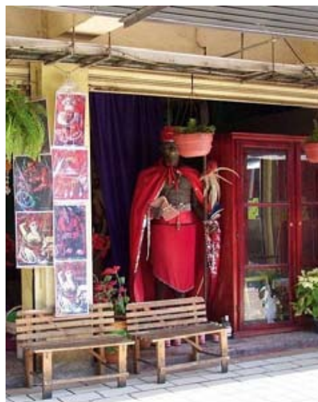
Figura 2: Representación de Changó. Botánica en el Mercado de Sonora.