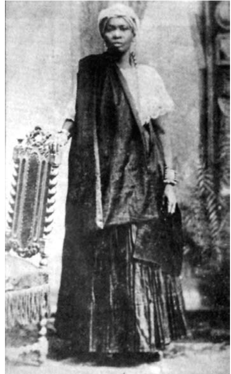
Figure 8–9: Pulquéria da Conceição Nazaré, 2nd high priestess of the Gantois, and her mother, African freedwoman Maria Júlia da Conceição Nazaré, founder of the temple. Collection of the Instituto Geográfico e Histórico da Bahia, Salvador, Bahia, Brazil.