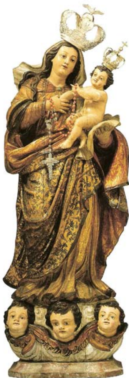
Figura 1: N. S.do Rosário - séc. XVIII (c. 1730). Escultura em madeira, 118x50 cm. Sines, Igreja Matriz. Comissão Nacional para as Comemorações dos Descobrimentos Portugueses. Catálogo da Exposição Negros em Portugal.

nas antecedida pelas do Rosário do Rio de Janeiro e de Belém organizadas, respectivamente, nos idos de 1639 e 1682.