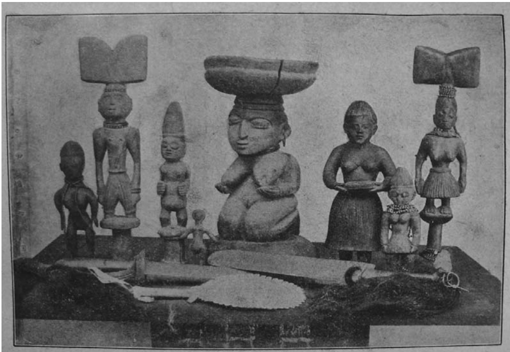
Figure 10: Candomblé sculptures and ritual objects, ca. 1900. Published in 1932, in Nina Rodrigues, Os Africanos no Brasil .

These aesthetic choices provide important insights into an epistemological code that governs not only audiovisual and written registers but even the oral circulation of religious knowledge. Certain aspects of this knowledge are the exclusive domain of the upper echelons of the priesthood. Whether this information is communicated via face-to-face interactions, written texts, or photographic images, care is taken to prevent unauthorized access. New initiates are taken into the elders' confidence step by step, over the years. Publications, photography exhibits, films and audio recordings thus are prob-