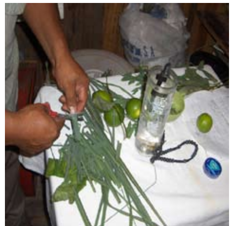
Figure 4: Herbs are being prepared for a sick man said to be suffering from a sorcery attack. Note the Santería glass containing water and a crucifix.