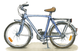
Cykel med två hjul