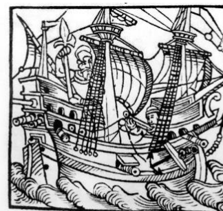
Figure 1 The sinking of 'Mars' was a spectacular victory for the Danish-Lübeckian fleet. This is the title page of a ballad, written in Low German, describing the battle. (After Ekman and Unger, 'Svenska flottans sjötåg', 177)

Illustration använd i artikel av Niklas Eriksson: How large was Mars? An investigation of the dimensions of a legendary Swedish warship, 1563-64.