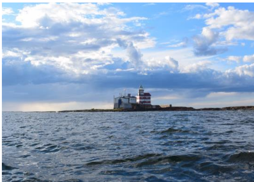
Skäret Märket, väster om Åland, sett från havet. Märket är i centrum för en publikation av Ida Hughes Tidlund.