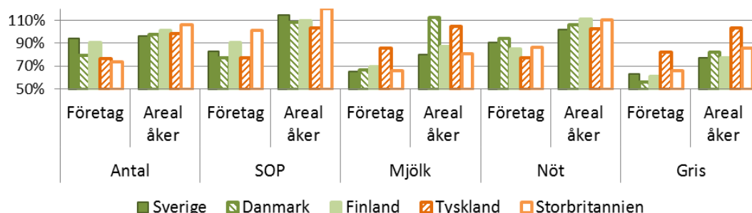
Figur 1: Antal företag och åkerareal år 2010 i procent av 2005 års värden (2005=100).