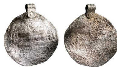
Figur 3, Foto: Florent Audy