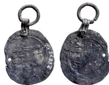
Figur 26