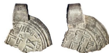
Figur 12

Inhumationsgrav, båtgrav från ett gravfält vid en gård i Tuna. Totalt undersöktes 19 gravar varav 10 eller 11 var rikt utrustade båtgravar. Graven hittades dock förstörd innan utgrävningen påbörjades. Föremålen hittades av markägaren utspridda på ett område på några m 2 . Fynden hittades i två omgångar, den första benämndes Inv. 9404 och den andra Inv. 9819. Fynd av över 150 spikar och järnbeslag gör det troligt att det är ännu en båtgrav.