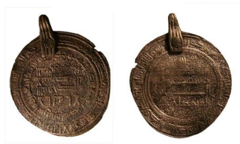
Figur 5, Florent Audy