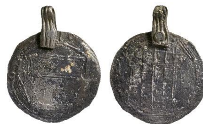
Figur 10 , Foto: Florent Audy

Datering: Mynt-Tpq: 809/10, BP VIII/IX: 915–950/960–980 (Callmer 1977:77; Audy 2018:301f).