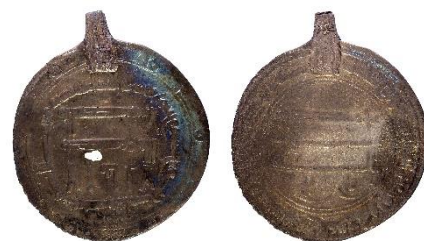
Figur 11 , Foto: Florent Audy

Datering: Mynt-Tpq :850 (utifrån dateringen av de nordiska mynten), BP XII : 980–990 (Callmer 1977:77; Audy 2018:303–304).