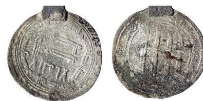
Figur 13 , Foto: Florent Audy