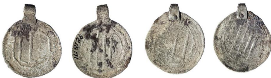
Figur 18, Foto: Florent Audy