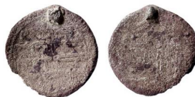
Figur 24