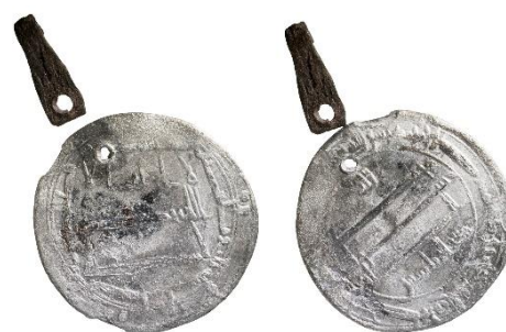
Figur 7, Foto: Florent Audy

Datering: Mynt-Tpq : 917/18 (präglingsår av en av dirhemerna i graven), BP VIII : 915–950 (Callmer 1977:77; Audy 2018:300)