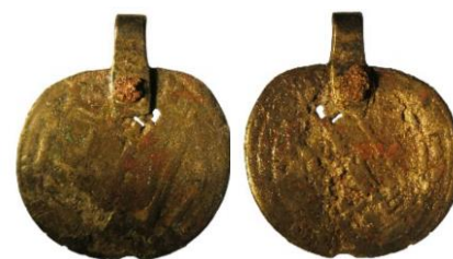
Figur 21

Datering: Mynt-Tpq : 763/4, graven dateras i den arkeologiska rapporten till 800-tal.