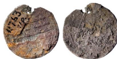
Figur 23