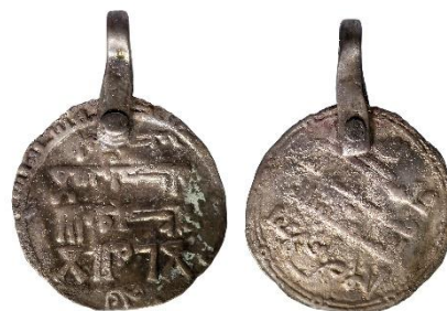
Figur 8

Datering: Mynt-Tpq: 911/12, BP IXA: 960–980 (Callmer 1977:77; Audy 2018:301)