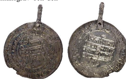
Figur 6, Foto: Florent Audy

Grav 6, Adelsö sn, Björkö 834. Hemlanden gravfält (1C)