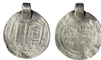
Figur 14, Foto: Florent Audy

Datering: Mynt-Tpq: 784/5, BP: II: 820–845 (Callmer 1977:77; Audy 2018:306f).