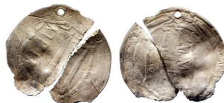
Figur 25

Inhumationsgrav, träkista, omärkt grav. Del av ett gravfält. I kistan hittades ett fragmentariskt skelett och ett antal föremål.