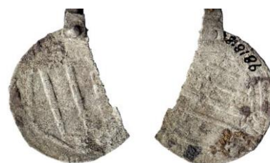
Figur 16