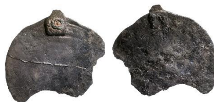
Figur 9 , Foto: Florent Audy

Datering: Mynt-Tpq: ca 785, BP VIII: 915–950 (Callmer 1977:77; Audy 2018:301)