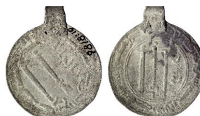
Figur 17