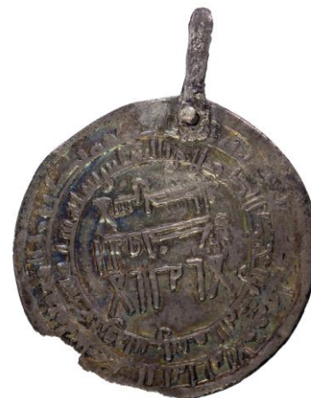
Figur 1, Islamiskt myntsmycke från Adelsö sn, Björkö 731, Hemlanden gravfält (1B).

Avslutningsvis ser man under vikingatiden ett antal smycken som inkluderar mynt som har modifierats genom att böjas, skäras eller inkorporeras som en mindre del av andra smycken. Mynten i dessa smycken har ofta förlorat sin form och har förändrat så pass mycket att de visuellt inte kan uppfattas som mynt längre. Dessa typer kan inte anses som myntsmycken då myntet inte längre är en central del av smyckets ornamentik. (Audy 2018:45–46).