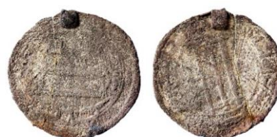
Figur 22, Foto: Florent Audy

Myntsmycken: Ett islamiskt myntsmycke av abbasidisk typ och en silverögla från ett annat myntsmycke. Det islamiska myntet var präglad i Madinat al-Salam 814/5 (Figur 22) medan ögla inte kunde utge någon information om det andra myntsmycket. Hittades i brandlagret (Petré 1999:31–2).