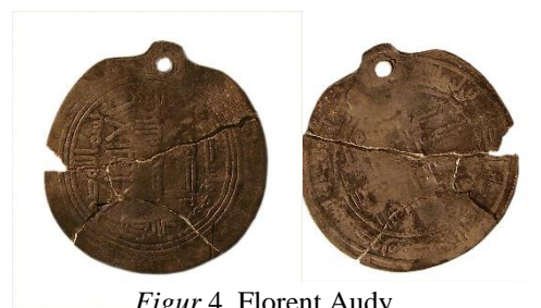
Figur 4, Florent Audy