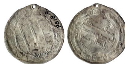
Figur 15