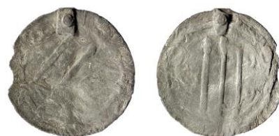
Figur 20

Grav 14, Gamla Uppsala sn, Prästgården 36.