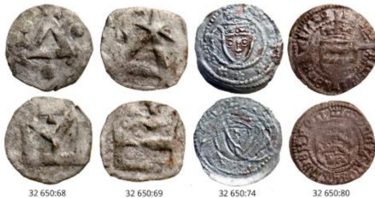
Bild 3: Mynt från Falsterbo 9:75, ej i skala. Mynt 32650:80 inte med i denna uppsats. Från Per Sarnäs rapport Falsterbo 9:75.

Falsterbo 9:33: LUHM nr, 32709:34, MB 133, Grinder- Hansen, 1259–1269, myntort: Halland. Halländskt mynt.