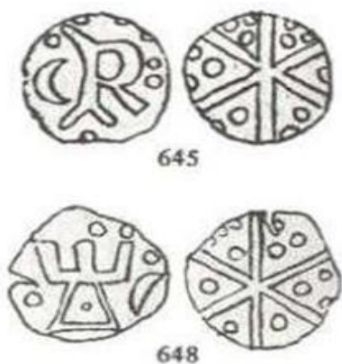
Bild 5: Illustration av mynten MB 645 och MB 648. Ej i skala. Från Danskmoent.