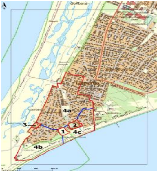
Bild 2: Karta över marknadsområdet (4a, 4b och 4c). Från Kenneth Anderssons uppsats.