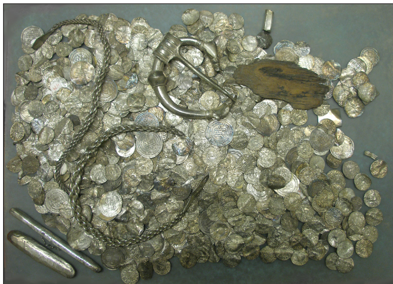
Fig. 16. Del af skat fra Karls, Tingstäde sogn, Gotland.

teristiske for perioden. Lokale mønter var klart i mindretal, og nye og gamle mønter langvejsfra accepteredes for deres metalværdi. I deres oprindelige hjemlande havde disse mønter været garanteret af magten, og man kunne anvende dem efter antal til officielt fastsatte pålydende værdi, og udenlandske og gamle mønter var bandlyst. I Nord- og Østeuropa havde den oprindelige møntherre imidlertid ingen autoritet og kunne derfor ikke garantere værdien. Derimod blev mønterne værdsat for deres indhold af sølv. Mønter blev fragmenterede for at få beløbet til at stemme, og de blev testet ved knivmærker og bøjning for at se, om metallet var godt. Alle disse fænomener indebærer, at det er let at genkende et skattefund af vikingekarakter. Og følgelig også at give en datering på vikingetiden, numismatisk set.