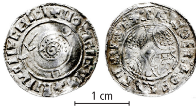
Fig. 18. Knud den Store (1018–1035) eller Hardeknud (1035–1042), penning af ormtypen, Lund, ca. 1030–1040. Privat eje.

Nogle gange har denne fokusering på regeringerne faktisk medført, at man ikke bare fik et sløret billede af mønthistorien, men et decideret forkert billede. Som eksempler kan nævnes to stærke danske konger fra 1000-tallet, hvis hovedmøntsted var Lund i Skåne. Det drejer sig om Knud den Store (1018–1035) og Svend Estridsen (1047–74). I Knud tidlige år blev der udmøntet forskellige efterligninger af engelske mønter med meget varierende – ofte høj – vægt. I den sidste del af regeringen var udmøntningerne helt anderledes. Vægtstandarden var velreguleret og hvert møntsted havde mere eller mindre sin egen letgenkendelige standardtype. Det have Kristian Erslev faktisk allerede set og fremlagt i en artikel publiceret i 1875 (Erslev 1875) – men siden forsvandt denne indsigt fra de brede fortællinger om dansk møntvæsen. Knuds regering blev behandlet som et hele uden tydeligt at skelne mellem de tidlige