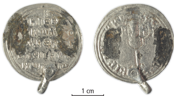
Fig. 1.

Publicerad i: Christoph Kilger (red.), Tidig medeltida bebyggelse, hamnområde och fiske i Västergarn Arkeologisk undersökning 2022 (Arkeologiska fältrapporter nr 25), Uppsala universitet Campus Gotland 2023, s. 158.