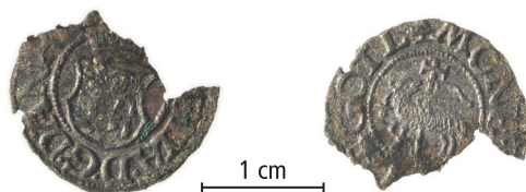
Fig. 3–5.

Publicerad i: Christoph Kilger (red.), Tidig medeltida bebyggelse, hamnområde och fiske i Västergarn Arkeologisk undersökning 2022 (Arkeologiska fältrapporter nr 25), Uppsala universitet Campus Gotland 2023, s. 159–161.