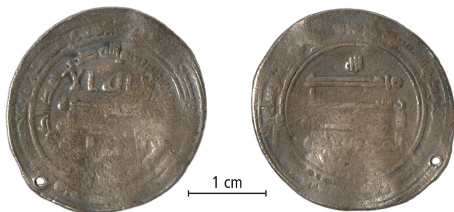
Fig. 6.