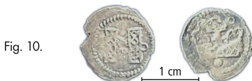
Fig. 9–10.

Båda är metalldetektorfynd från plöjningslagret på en boplatz från yngre järnålder.