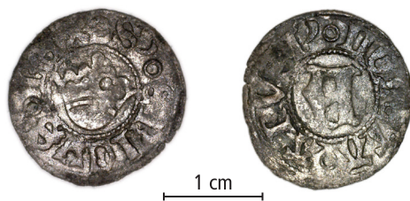
Fig. 8.

Det fanns också en medeltida brakteat (F2), som inte kunde bestämmas utifrån foton. Bestämningen får vänta tills myntet har undersökts närmare.