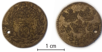
Fig. 2.