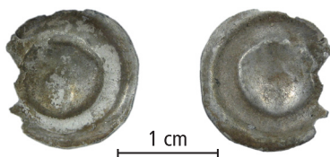
Fig. 7.

Påträffats vid avbaning inom en yta som inhyser en medeltida byggnad.