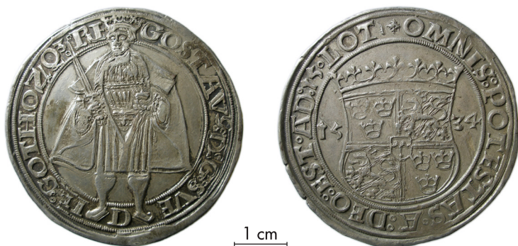
Fig. 17. Gustav Vasa, daler 1534, Lunds universitets historiska museums myntkabinett.

sølvmonter, som man helt objektivt kan spore og datere. I Norden drejer det sig om mark-stykker og sølvgylden/dalere. Men spørgsmålet er, hvornår man skal sætte den helt præcise kronologiske grænse, så man kan organisere sine møntsamlinger og fortælle den store mønthistoriske beretning. Skal det være, når de første spæde forsøg med prægning af stormønt forekommer? Eller når de bliver mere almindelige? Eller når de bliver integreret i det eksisterende møntsystem med fast kurs i forhold til de andre mønter? Eller noget helt andet?